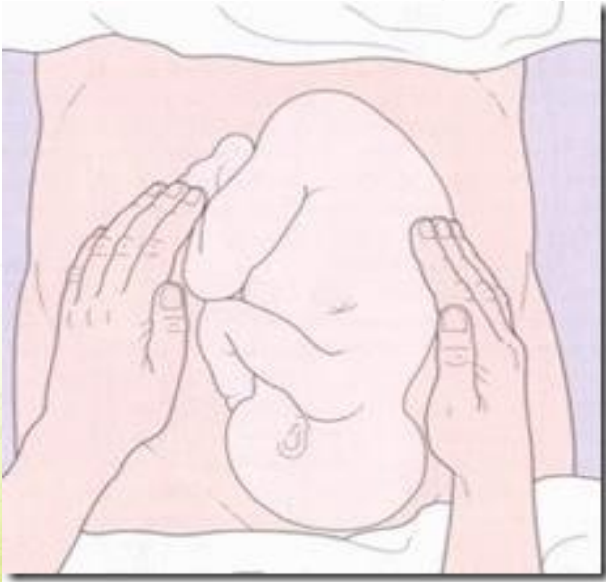
AKPER HKBP BALIGE