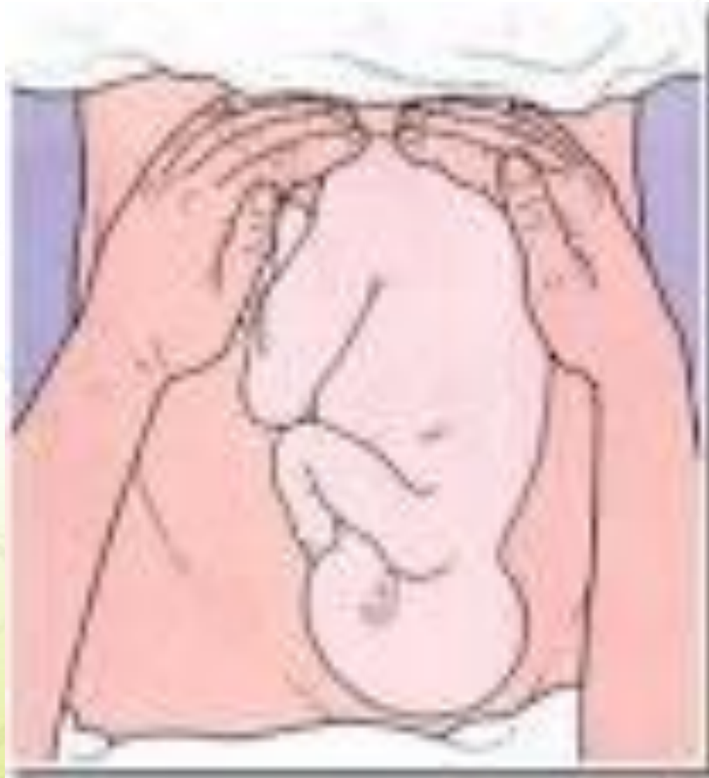
AKPER HKBP BALIGE