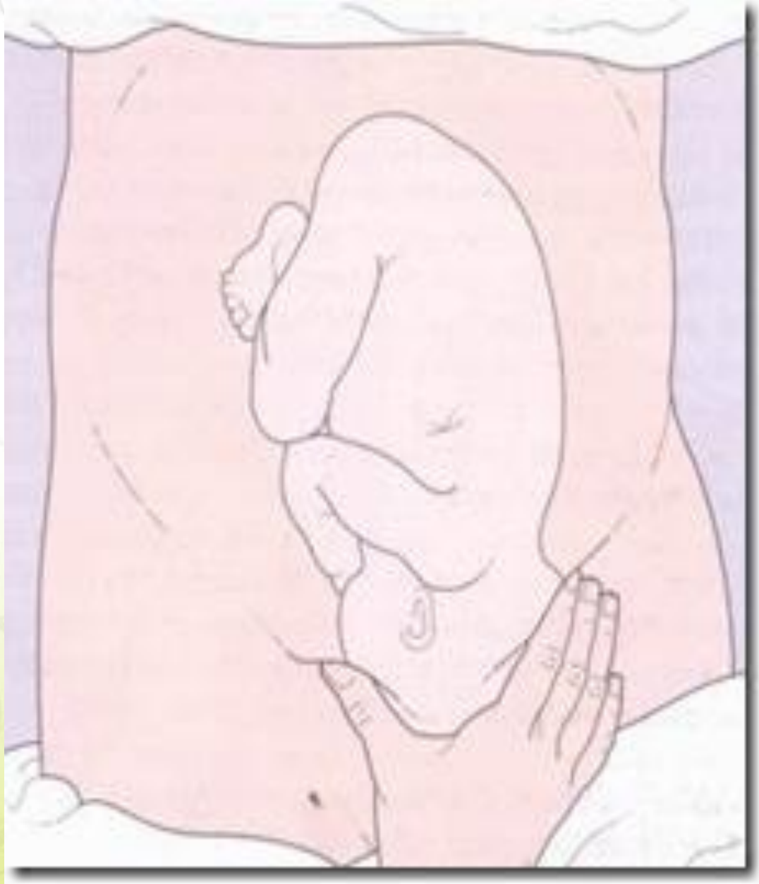
AKPER HKBP BALIGE